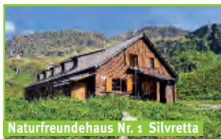
Naturfreundehaus Nr. 1 Silvretta